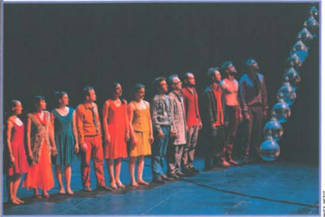
Sept circassiens, acrobates, clowns, équilibristes et six musiciens composent la scène et happent le spectateur sur le chemin de la poésie.

» tion qui sied parfaitement à la démarche du cirque Plume, plongé dans l'onirisme du réel plutôt que dans la virtualité du 3.0.